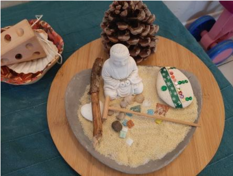
1er jardin zen réalisé dans une coupelle