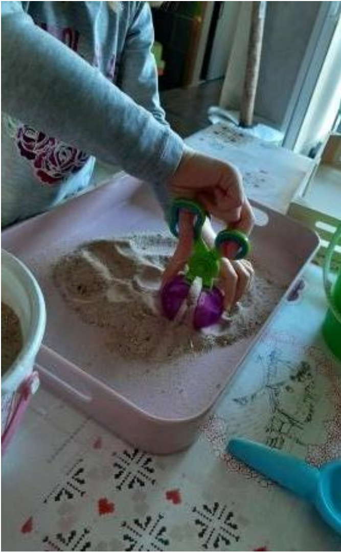
Elsa s'amuse avec une pince boule