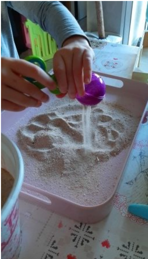
Elle laisse passer le sable à travers les trous