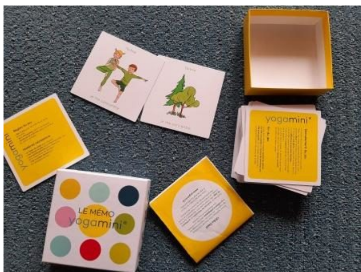
Le Mémo Yogamini dès 5 ans

En parallèle, nous allons sûrement créer un mémo de Yoga nous mêmes prochainement, j'écrirai un article sur cette activité ! N'hésitez pas à écrire vos commentaires et j'espère que l'article vous a plu.