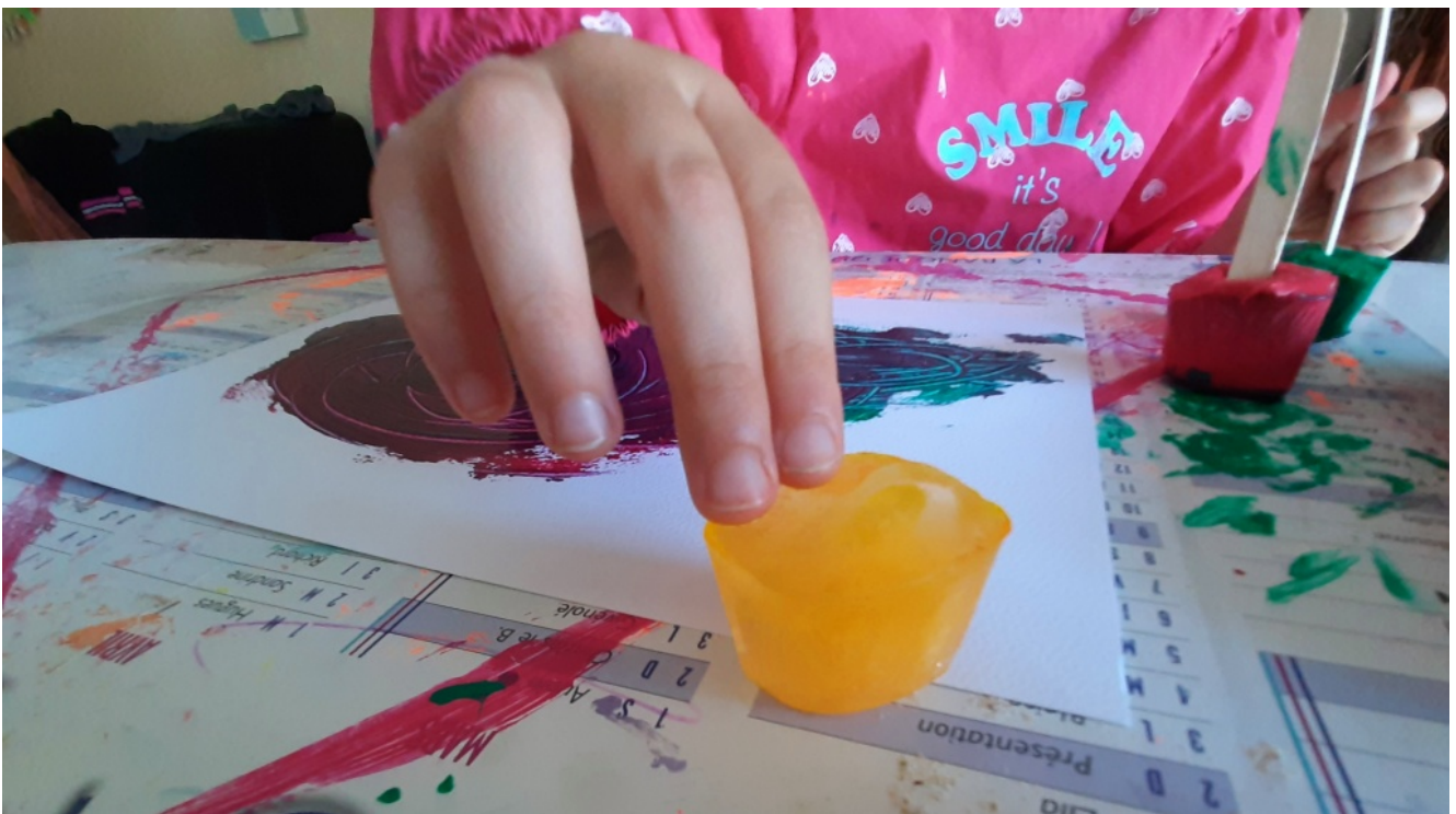
Découverte de la peinture aux glaçons avec les doigts