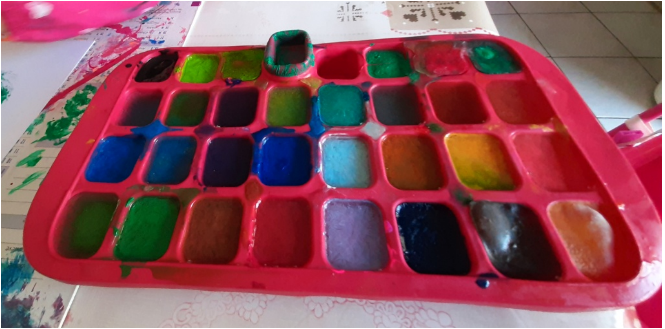
Découverte de la texture du glaçon avec les doigts