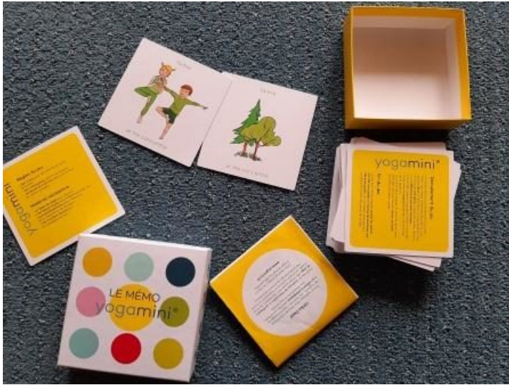
Le MémO Yogamini dès 5 ans