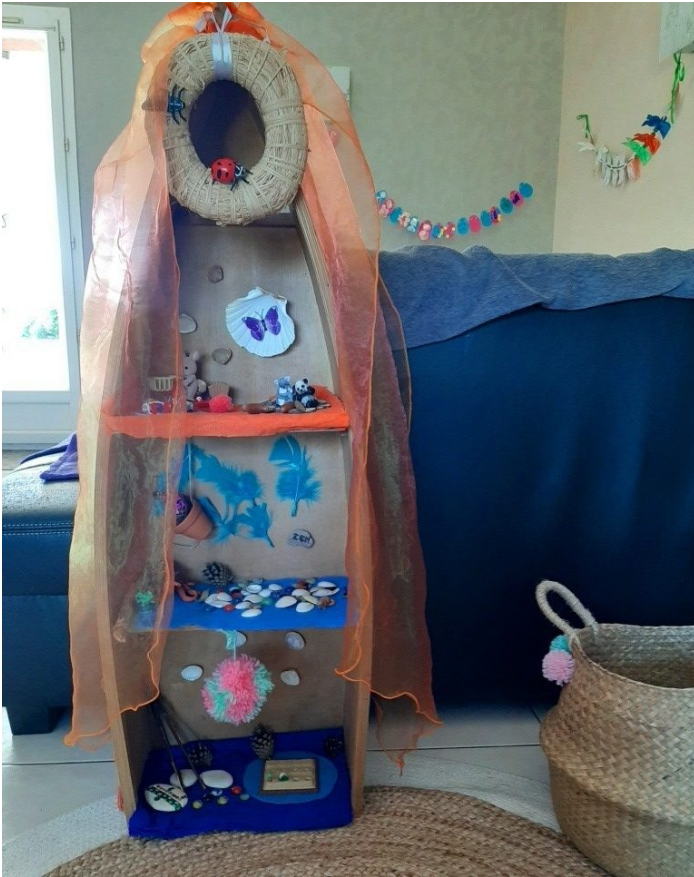
Table de l'été inspiration Waldorf

Nous venons de créer notre table de l'automne.