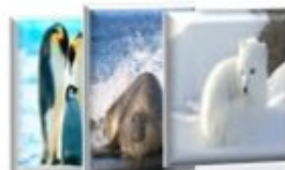
Les cartes classifiées

Dans ce jeu « recherche et trouve sensoriel », l'enfant va découvrir les animaux de la banquise de façon créative et originale.