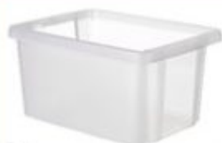
Bac en pastique transparent