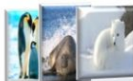
Les cartes classifiées

Dans ce jeu « recherche et trouve sensoriel », l'enfant va découvrir les animaux de la banquise de façon créative et originale.