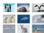
L'affiche des cartes à coller