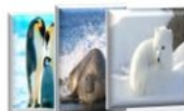
Les cartes classifiées

Dans ce jeu « recherche et trouve sensoriel », l'enfant va découvrir les animaux de la banquise de façon créative et originale.