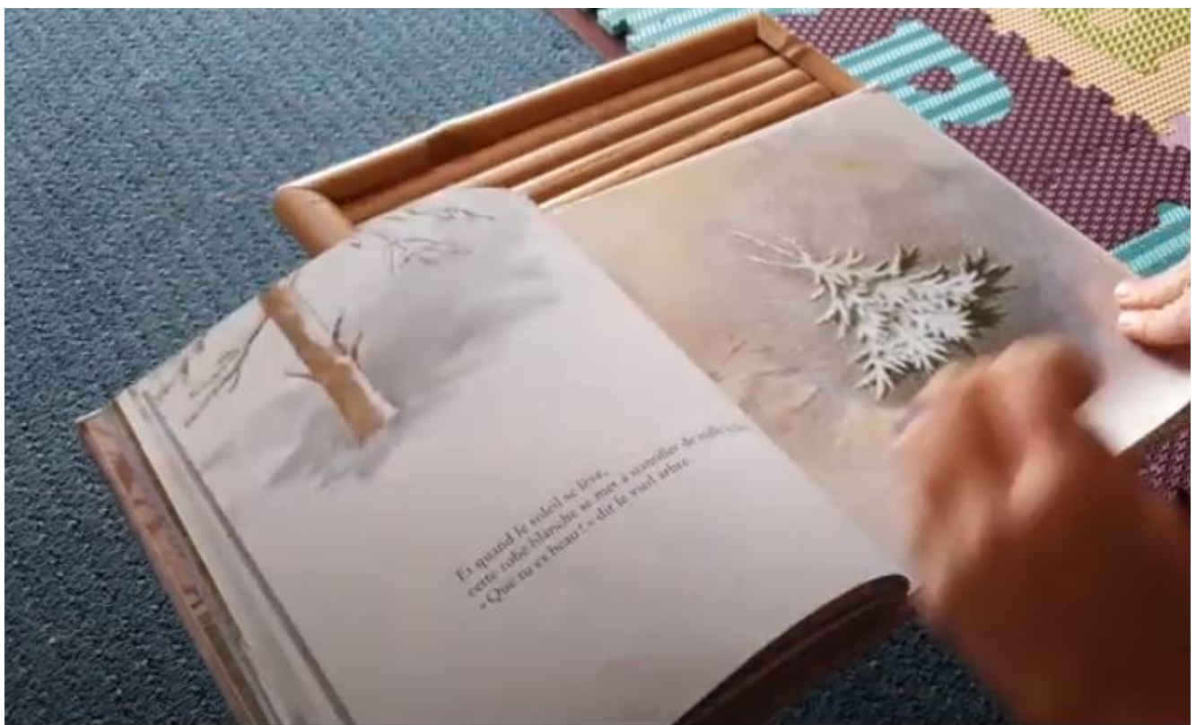
Le Noël de balthazar