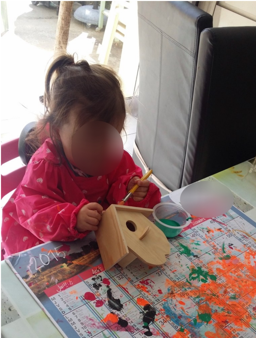
L'enfant peint le nichoir en bois