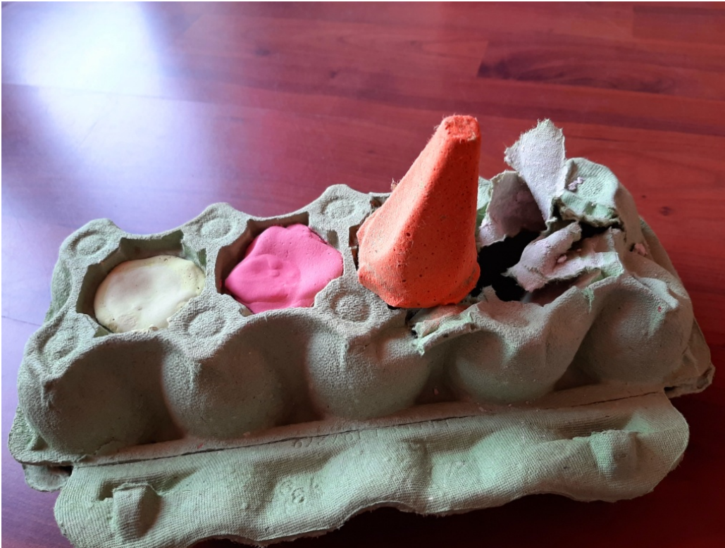
Démoulage des craies ! Ici environ 1 à 2 jours après !