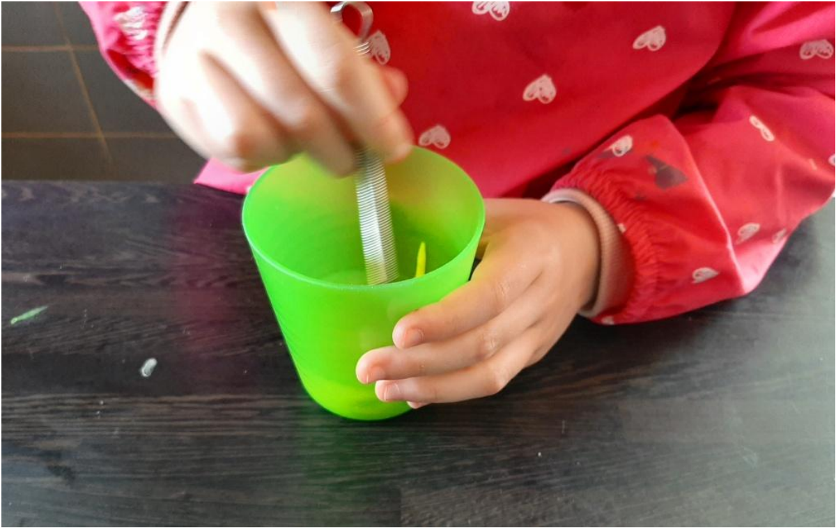
Mélange avec un mini fouet ou un pinceau