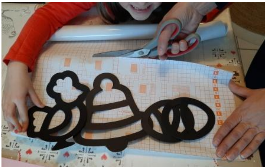
Découpage du papier transparent