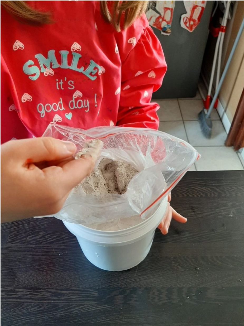
Ici découverte du plâtre...!