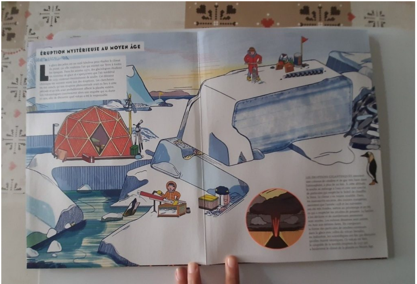
Pour les 6-10 ans il est parfait et visuellement très joli, ça donne vraiment envie de s'intéresser aux ☐☐ et cela donne une image concrète de l'éruption etc...