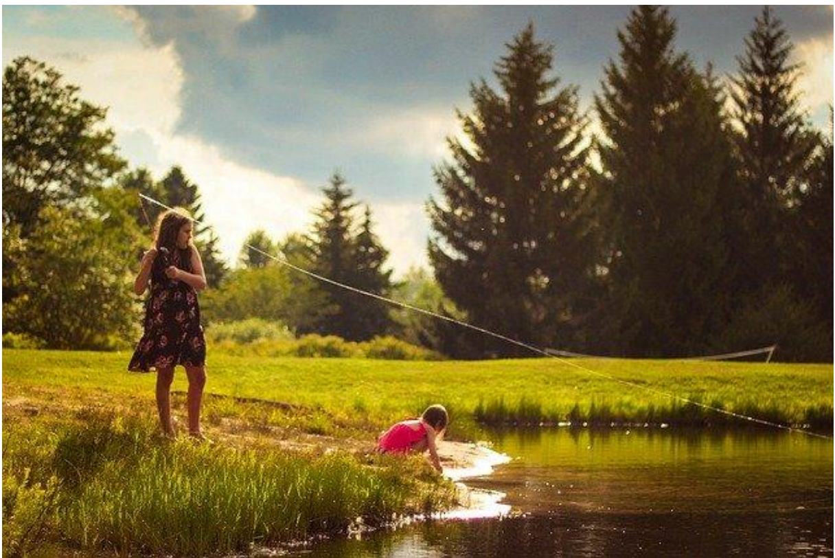
Pique-niquer au bord d'une rivière