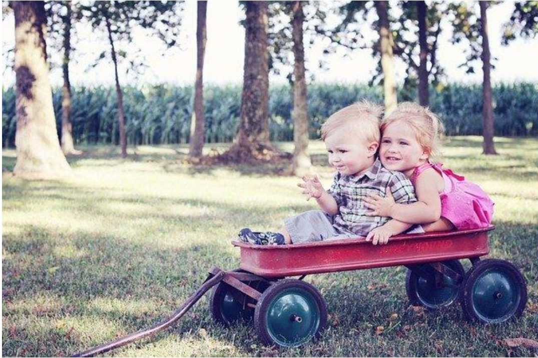
Laisser à l'enfant la liberté de se salir