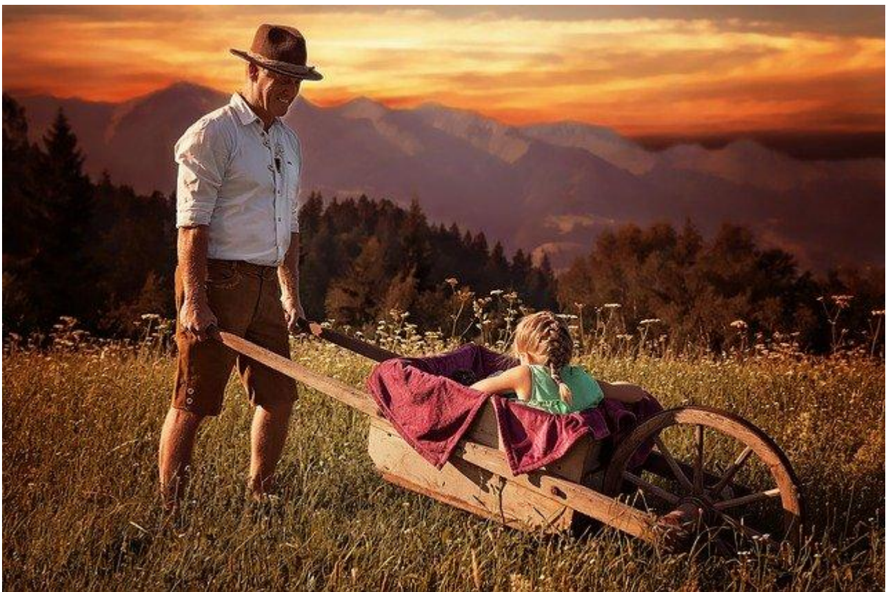
Découvrir de nouveaux paysages et explorer la nature