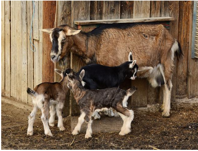
Se rendre dans une ferme pédagogique