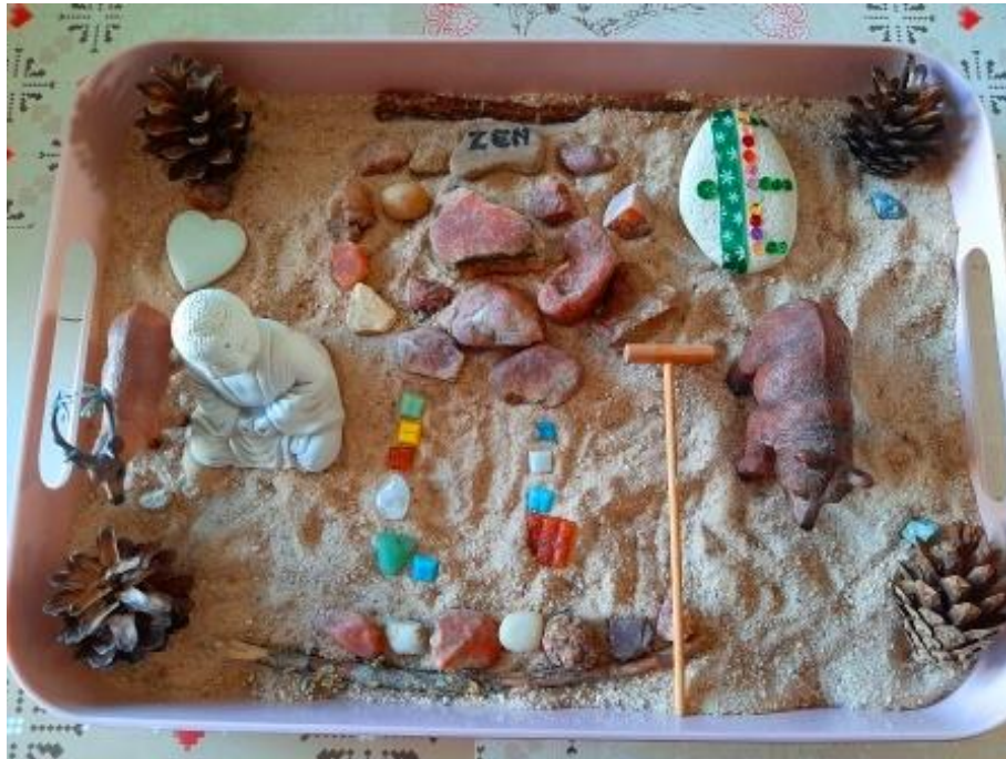
Faire un jardin zen, ou village zen