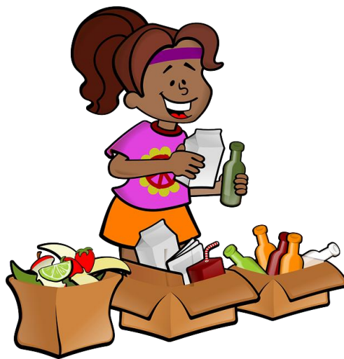
Sensibiliser l'enfant au recyclage