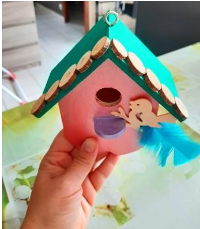
Fabriquer un nichoir ou une mangeoire pour les oiseaux